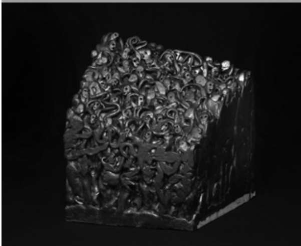
Ecke Nr. 1, 45 x 30 x 46 cm, 2009