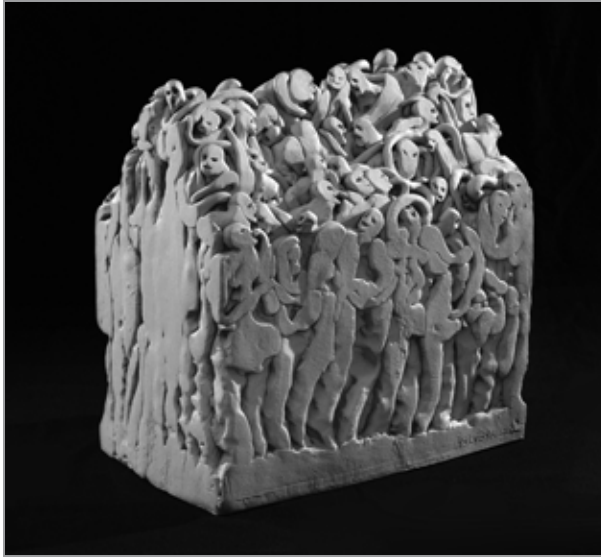
Haus Nr. 3, 30 x 18 x 30 cm, 2009