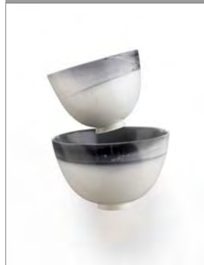
3 2 Horizonte, 2005, 13 x 10 cm, Foto: D. Beranek