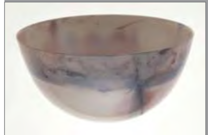
Hirnschale, 1999, 16,5 x 10 cm, Foto: L. Ellert