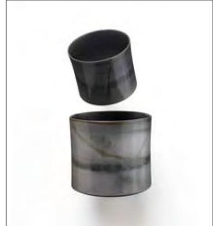
2 Landschaften, 2005, 13,5 x 12,7 cm