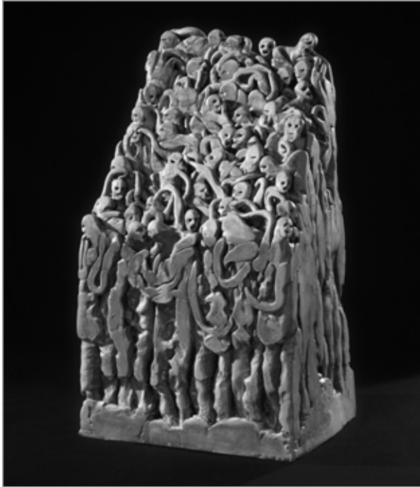
Turm Nr. 1, 34 x 24 x 58 cm, 2009