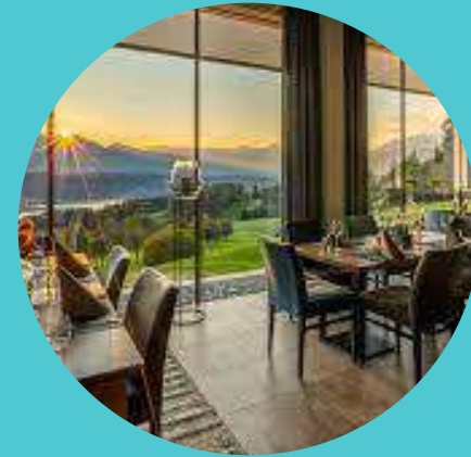
Nici's Golfrestaurant (Obermillstatt)