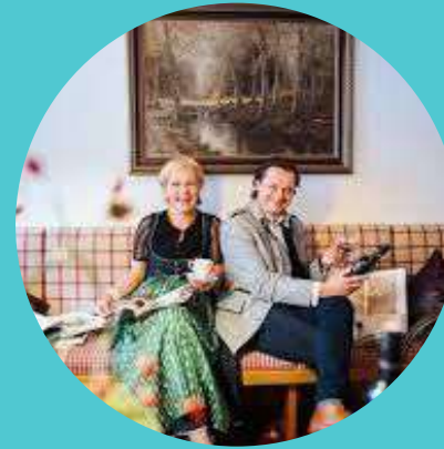
Lindenhof (Feld am See)