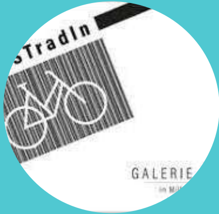
Kunstradln Café & Galerie (Millstatt)