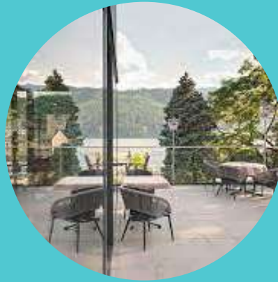
CAFE San Daniele (Millstatt)